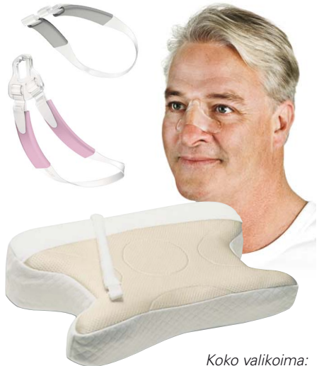
Koko valikoima: www.resmedtuotteet.fi