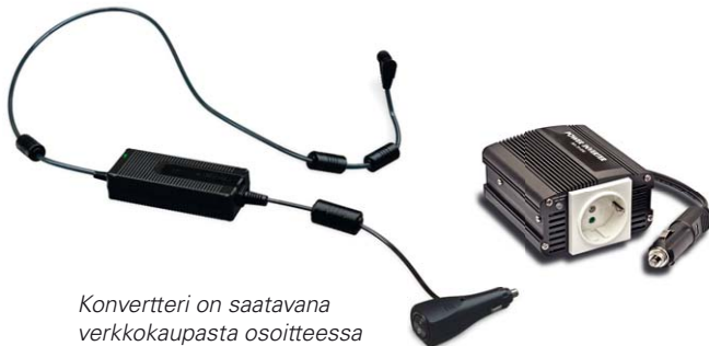
Konverteri on saatavana verkkokaupasta osoitteessa www.resmedtuotteet.fi

CPAP- ja VPAP-kaksoispainehoitolaitteita voi käyttää tietyin rajoituksin myös lentomatkan aikana. Ota yhteyttä lentoyhtiöön ja selvitä käyttöehdot hyvissä ajoin ennen lentoa. CPAP/VPAP-laitteet eivät vahingoitu läpivalaisuksessa.