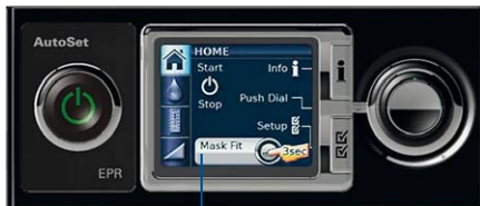
S9-sarjan maskin sopivuusnäyttö